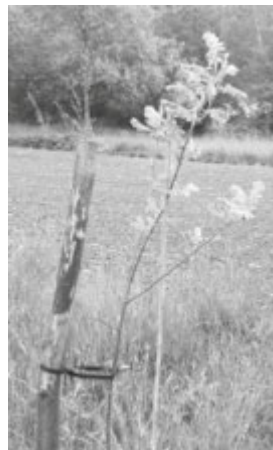
Unser jüngstes Vereinsmitglied - Sorbus domestica - Speierling

Bis hoffentlich bald mal wieder, Eure Pfahlbau-Erleber© Katrin und Christoph Zorn