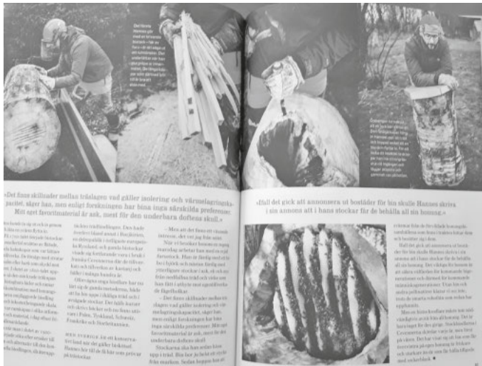
Dingelsdorfer steinzeitliche Klotzbeute (hängend) im schwedischen HEMSLÖJD

So und nun ein kurzer Blick in die direkte Zukunft vor Ort: